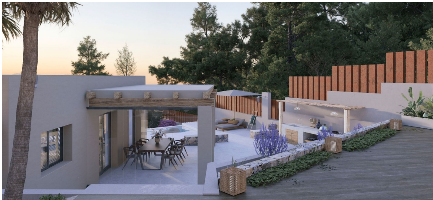
-Comedor y zona de barbacoa.