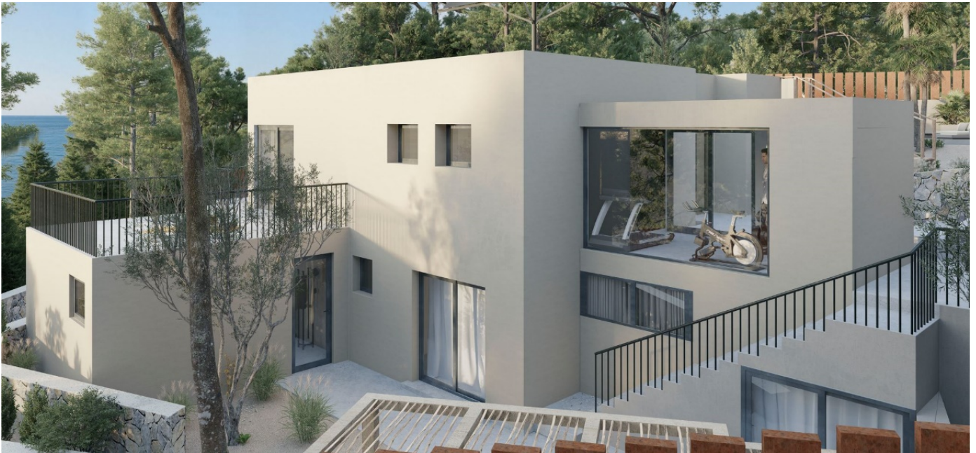
-Habitación y baño, en zona izquierda con acceso independiente desde planta baja