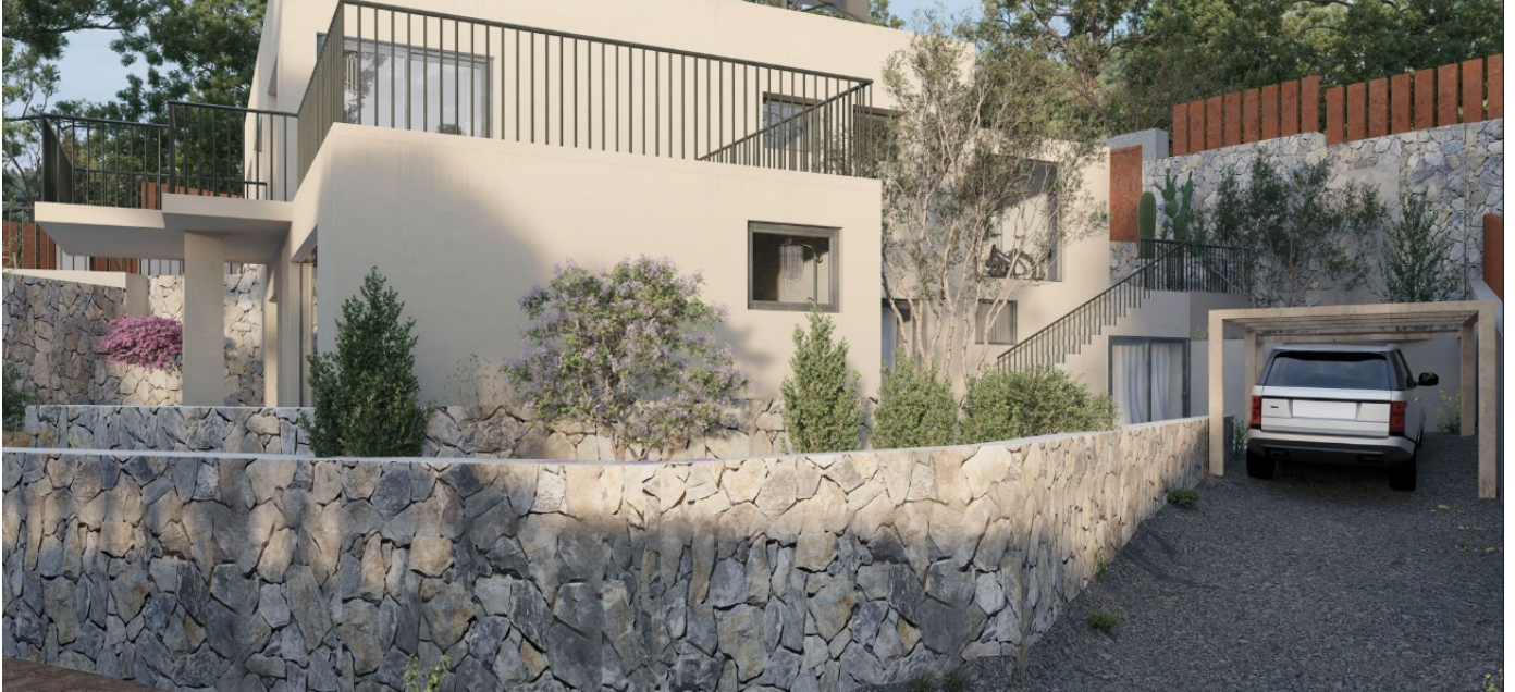
-Entrada de vehículos, con techado