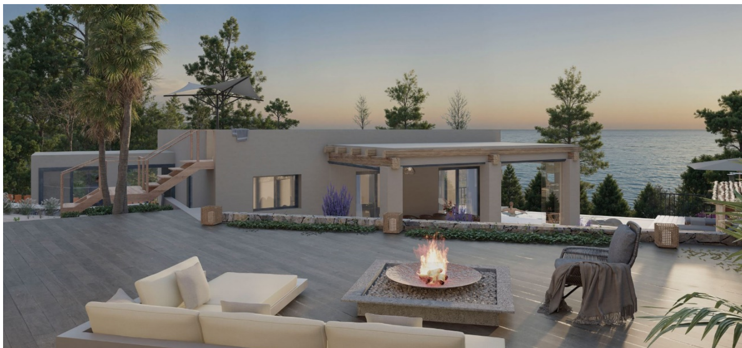
-Cenador en parte inferior, y escalera para acceso a la terraza ubicada en el techo.